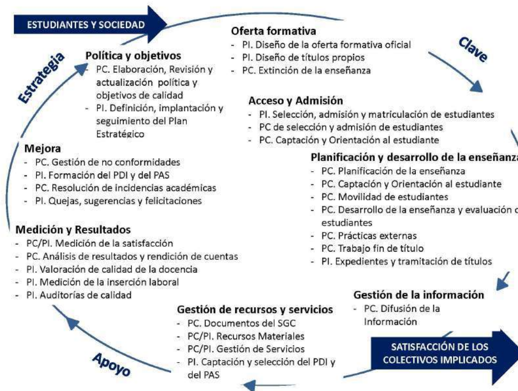
Figura 3. Mapa de procesos del Sistema de Gestión de Calidad del Centro

Con el fin de facilitar la visualización de las vinculaciones entre los procedimientos, ya sea institucionales, estratégicos, claves o de apoyo, con las distintas directrices del Sistema de Gestión de Calidad, se presenta este mapa de procesos en la figura 3.